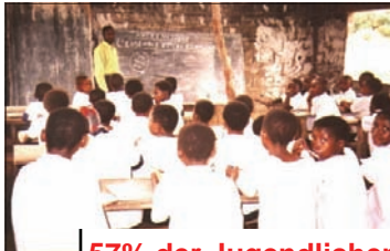
57% der Jugendlichen sind ohne Schulbildung