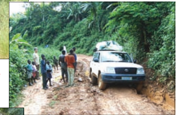
80% der Strassen sind in schlechtem Zustand