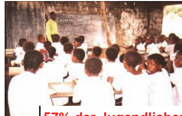
57% der Jugendlichen sind ohne Schulbildung