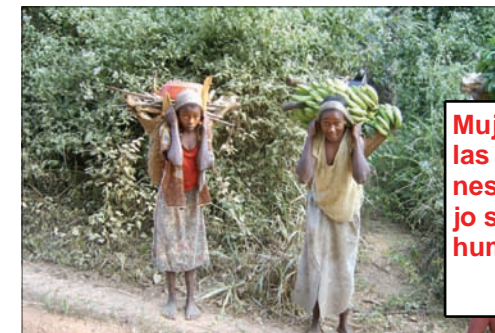
Mujeres: las condiciones de trabajo son inhumanas