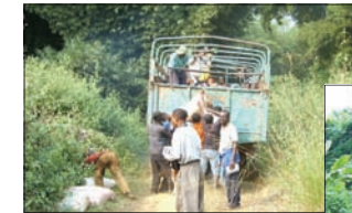
Carreteras: falta del medio de transporte