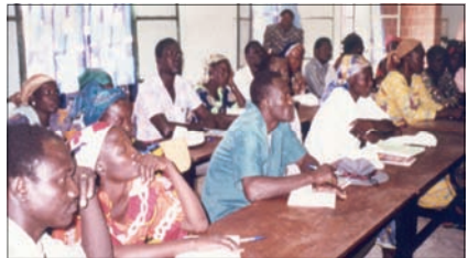
La formación de líderes, imprescindible para ir avanzando.