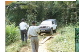
Vehículos para la Pastoral