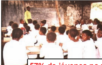
57% de jóvenes no van a la escuela