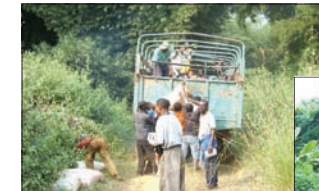
Carreteras: falta del medio de transporte