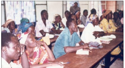
La formación de líderes, imprescindible para ir avanzando.