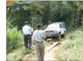
Vehículos para la Pastoral