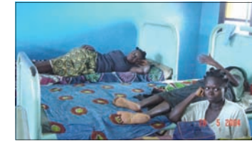
60% no tiene acceso a la Sanidad por falta de servicios y presupuesto