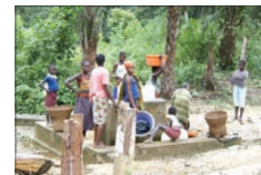
El agua potable está lejos de los pueblos