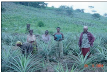
Plantación de piñas